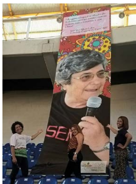
Homenagem do Grupo da Agroecologia