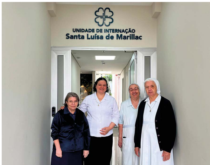
Irmãs da Comunidade do Hospital São Vicente de Paulo