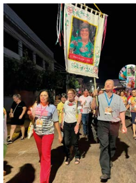
Homenagens no Encontro Intereclesial das Comunidades de Base -2023