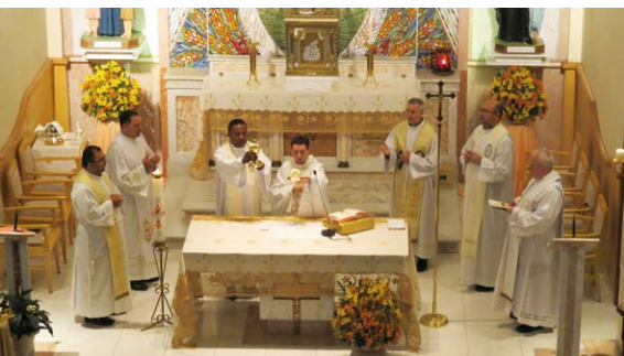
Missa dinamizada pela Província do Rio

No primeiro dia, as Províncias apresentaram, dinamicamente, suas respostas às linhas de ação propostas pelo XXI Interprovincial ocorrido em Recife em 2020, assim como as ações realizadas para o enfrentamento da pandemia. Também apresentaram os dados estatísticos de suas províncias. Ao longo do encontro, as Províncias se revezaram na preparação da liturgia do dia.