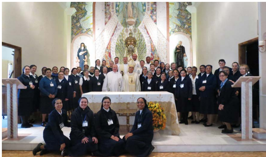
Participantes na Missa de Abertura

No primeiro dia, as Províncias apresentaram, dinamicamente, suas respostas às linhas de ação propostas pelo XXI Interprovincial ocorrido em Recife em 2020, assim como as ações realizadas para o enfrentamento da pandemia. Também apresentaram os dados estatísticos de suas províncias. Ao longo do encontro, as Províncias se revezaram na preparação da liturgia do dia.